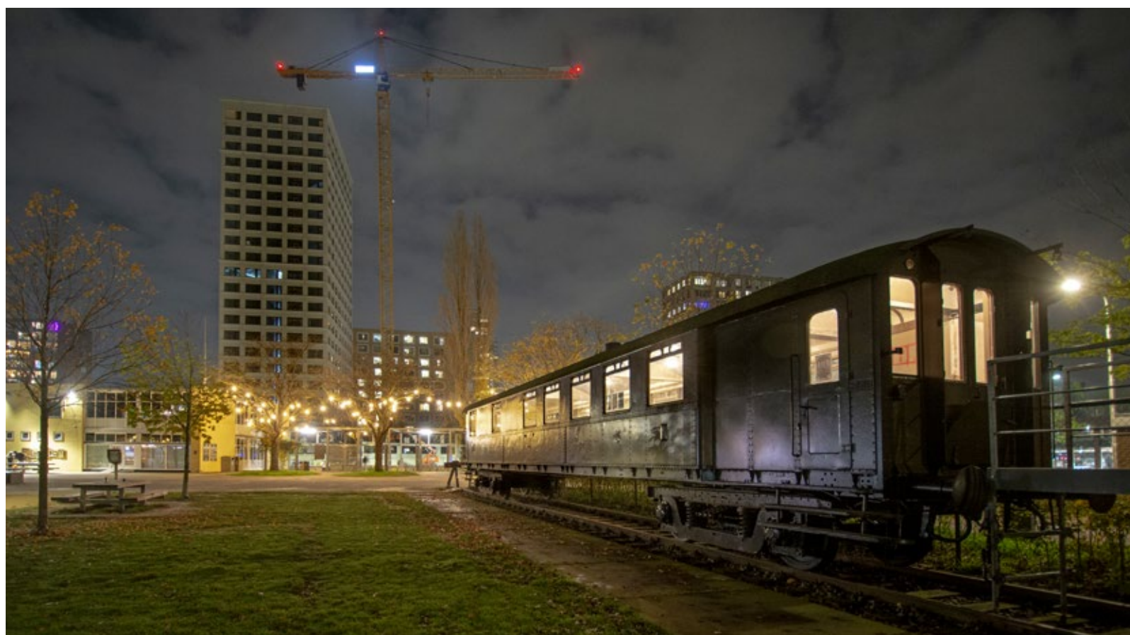
Het opknappen van het rijtuig op de Stadscamping vordert gestaag.