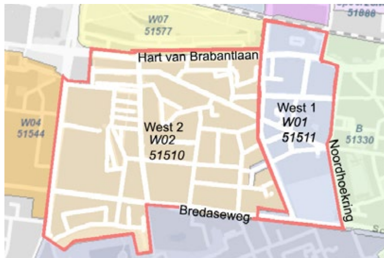
Parkeerzones West 1 en West 2.

nogal terughoudend met betaald parkeren in woonwijken. Wijkbewoners rondom CZ en het hoofdbureau van politie (Ringbaan-West) hebben jarenlang gevraagd om betaald parkeren. Sinds dit er uiteindelijk in 2018 is gekomen, is stapsgewijs de loper uitgerold. Inmiddels is vrijwel het gehele gebied binnen de ringbanen parkeerzone gemaakt. In de Reit geldt de regulering inmiddels